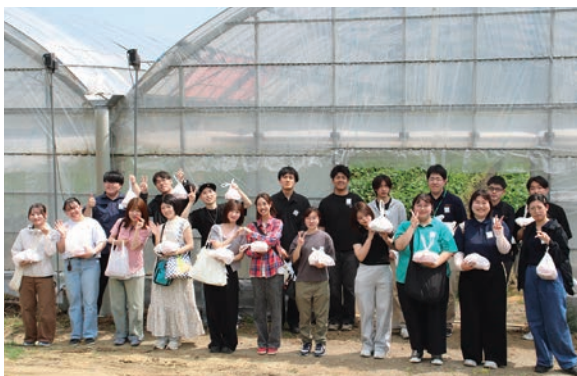
いちご収穫を体験した新入職員ら

研修後は、同JAの常勤役員や各支店長、先輩職員も加わり、懇親の場として食事を開き、職員同士や役員との交流を通じて、職場の一体感を高めました。