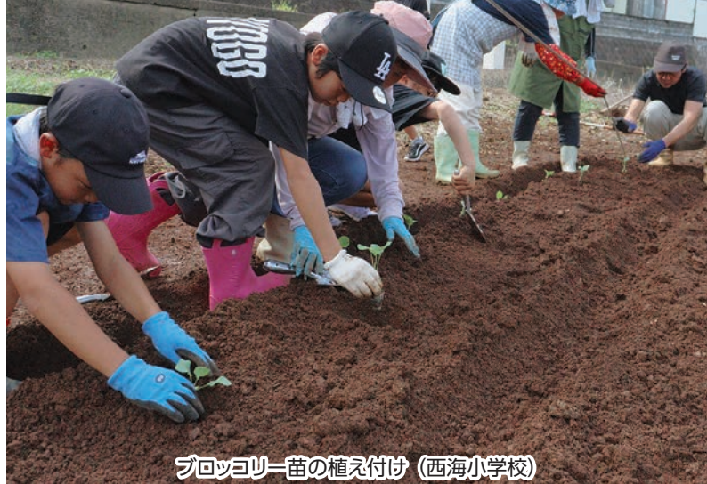
ブロッコリー苗の植え付け（西海小学校）