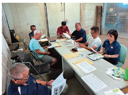
寄せられたメッセージを見る部会員ら