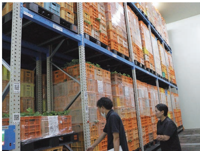
予冷施設に預けたいちご苗