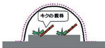
図2 浮きがけ（トンネル掛け）