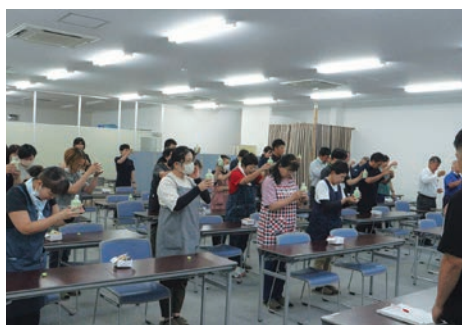
初選果式に約50人が参加