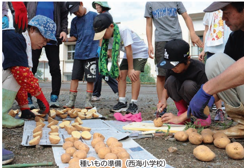
種いもの準備（西海小学校）