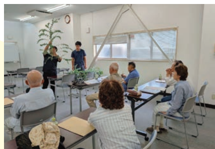
出荷規格を確認する生産者ら

ユーカーリは出荷時期の調整が可能で、軽量作物であるため、みかん経営にユーカーリ等の切り枝花木を導入してもらうことを呼びかけており、生産者の経営向上を目指しています。