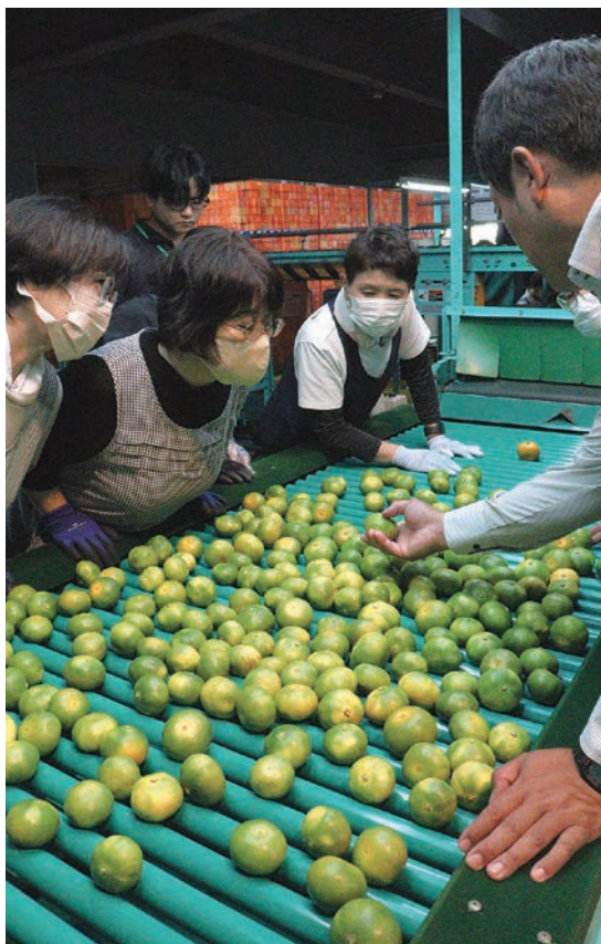
初選果。従業員への目揃えも

今年は部会員774人が727・8畝で栽培。着果は多く表年の様相で、全体で6,250トンを計画しています。