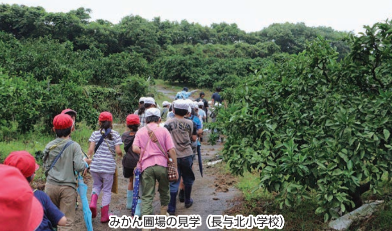
みかん園の見学（長与北小学校）