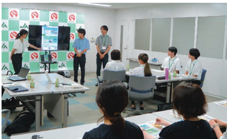
県立大学生によるプレゼン

参加した学生からは「地域の方とふれあいながらの仕事は楽しかった」「契約農家さんのお宅を訪問するのは新鮮だった。窓口業務では職員さんの丁寧な接客に感動した」などの感想が寄せられました。