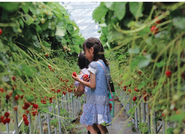
いちごハウスで収穫体験。人気イベントの一つ。

「食育」とは、食に関する知識を身につけ、食の大切さを考え、実際の生活の中で健やかな心と体を育むこと。食えることを通じて命や健康、文化、そして地域を学び、次世代へとつないでいく取り組みです。栄養や食べ方を学ぶだけでなく、「誰がどこで、どのように作っているのか」を知ること大切な学びの一つです。