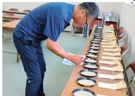
米目揃えのようす

同会に当JA所属の農産物検査員10人が参加。全農ながさきから講師を招き、本年の検査における留意事項や米情勢についての研修も実施しました。検査員は知識を深め、地域の米づくりを正確な検査で支える姿勢を改めて確認しました。