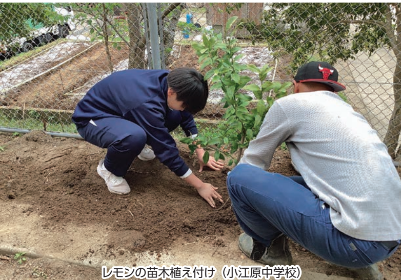
レモンの苗木植え付け（小江原中学校）