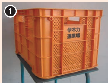
色：オレンジ 印字：伊木力選果場