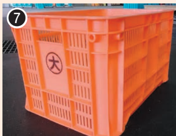
色：オレンジ 印字：○内に 大