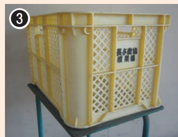
色：黄 印字：長与農協撰果場