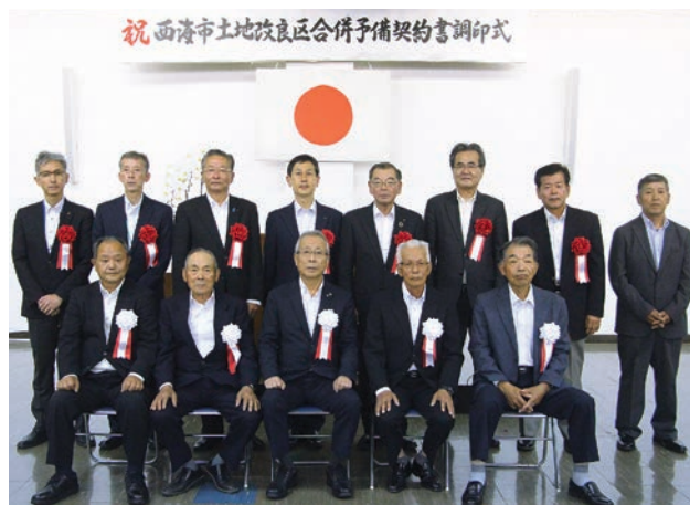
合併予備契約書に調印した各土地改良区の理事長ら

来年2月の合併認可を目指す西海市の4土地改良区は5月27日、JA長崎せいひ北部営農センターで西海市土地改良区合併予備契約書調印式を行いました。合併することで財政基盤の強化、施設の維持・管理・更新事業の実現、事務の効率化が期待されます。