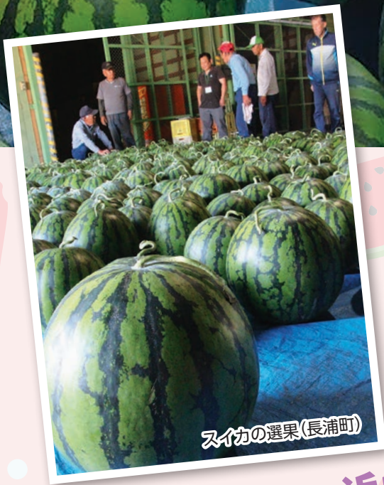
スイカの選果(長浦町)

琴海地区で「長浦西瓜」の出荷が6月3日より始まりました。本年産のスイカは天候に恵まれ、甘みがあり実の詰まった大玉のスイカに仕上がっています。琴海地区瓜類研究会は一つ一つ外観をチェックし、重さを確認しながら選果を行いました。