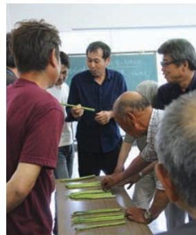
出荷規格を確認する生産者ら

本年産の春芽アスパラガスは2月12日から開始されました。出荷開始当初は気温が高めに推移したことで昨年並みの数量となりましたが、2月末からは気温が低い日が多く不安定な天候が続いたことで、太物の発生率は低く出荷量は伸びず春芽の出荷量は前年比79%、反収は前年比87%にとどまりました。夏芽アスパラガスは6月から10月頃にかけて出荷され、7月上旬がピークと予想されます。夏場の高温対策や肥培管理、病害虫防除の徹底を図り、生産者・JA職員一丸となって栽培に取り組みことを報告しました。夏芽の出荷量は67トンを計画しています。