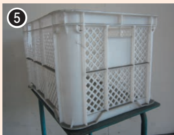
色：白 印字：☆内に 時