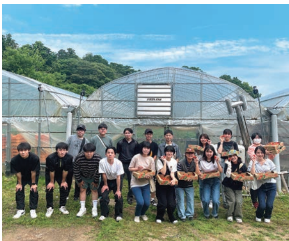
いちごの収穫を楽しんだ新入職員ら

新入職員らは(株)アグリ未来長崎が管理するハウスでのいちご収穫や懇親会を楽しみました。