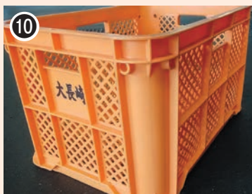
色：オレンジ 印字：大長崎