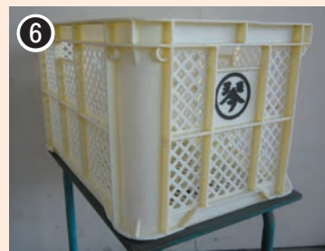
色：黄 印字：○内に 琴