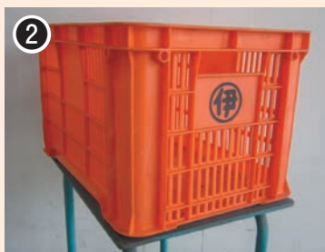
色：オレンジ 印字：○内に 伊