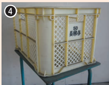
色：黄又はオレンジ 印字：50 長与