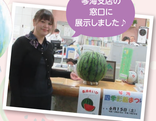
琴海支店の 窓口 に 展示しました♪