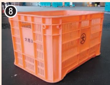
色：オレンジ 印字：大西海 〈側面〉○内に 大