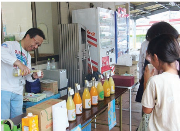
様々な柑橘の味を楽しむ来店客

同日は同JA長与支店職員も参加し、金融や共済のキャンペーンもあわせてPRしました。