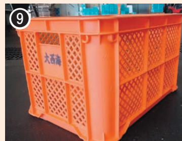
色：オレンジ 印字：大西海