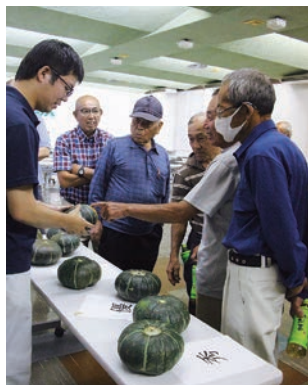
出荷規格を確認する生産者ら

同部会ではくり系統の「くり將軍」「くり五郎」を栽培しています。本年産の春作カボチャは作付面積が6・2畝（前年比131%）で前年より増加しました。5月中旬以降に定期的な降雨もあったため肥大は進み、概ね一番果は3L・2Lの出荷を見込みます。出荷は8月中旬まで続き、出荷量は58・3トンを計画しています。