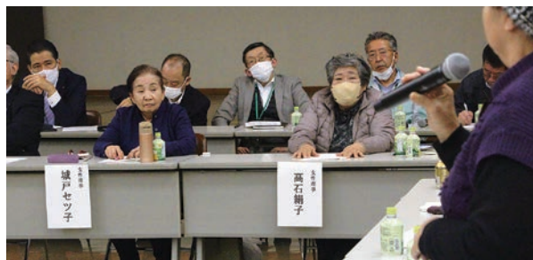
女性部員の意見を聞く役職員ら

2月8日、女性部とJA役職員の対話会を本店で開きました。女性部各支部の代表や役員、各部長、支店長、職員の約45名が参加。JA事業や活動に対する部員らの意見・要望を聞き、意見を交わすことで「地域のためにより良いJA」を目指すとともに、女性部組織の活動充実に繋がります。