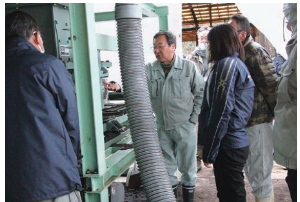
ペレットの製造現場を見学する関係者ら

J A長崎せいひをはじめ、県や西海市、J A全農ながさき、くみあい肥料などの団体が構成されている「長崎県堆肥利活用推進協議会」は、1月23日に堆肥入り肥料展示圃成績検討会・堆肥ペレット製造施設研修会を開きました。 同協議会は県内の地域未利用資源を活用した肥料の安定供給と低コスト化のため、①豚ふん堆肥のペレット化、②B B肥料へのブレンド、③露地野菜、かんきつ、茶等での実証試験に取り組んでいます。新肥料を普及させることで「みどりの食料システム戦略」（化学肥料20%）削減への対応、耕畜連携の地域リサイクルの実現、肥料