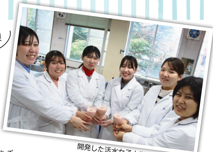
開発した活水女子大学3年生の皆さん

AGRI+ と活水女子大学の学生が協力し、管内産のいちごを使ったスムージーを開発し、2月23日から25日の3日間限定で販売されました。