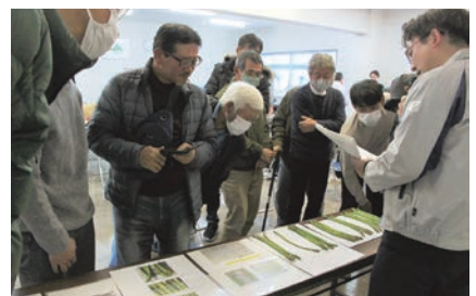
出荷規格を確認する部会員ら

また、同日には第7回総代会も開かれました。23年産の実績として、春芽の細物割合が増えたことや夏芽出荷時期の高温などで出荷量が伸び悩んだものの、単価については1,209円/キ（前年比107%）と前年を上回ったことを報告しました。