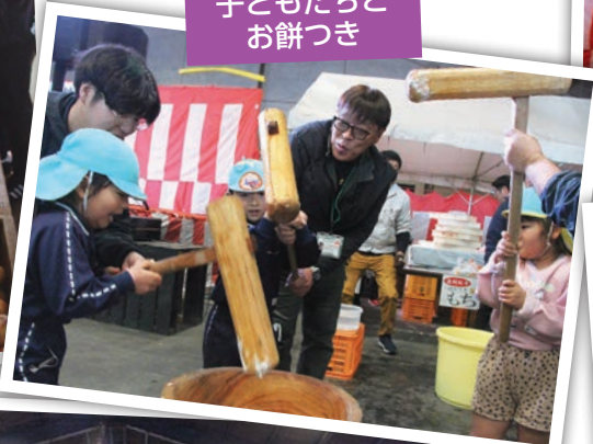
子どもたちと お餅つき