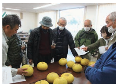
出荷規格を確認する生産者ら