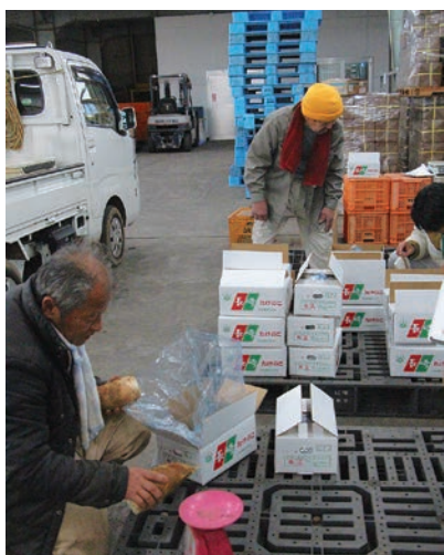
出荷されたタケノコを確認する部会員ら

茂木支店部会は、20人が茂木地区で栽培しており、同支店の集荷場には、朝取りの新鮮タケノコがずらりと並びます。青果は大阪の市場に3月下旬まで出荷され、その後加工用の出荷へと続きます。