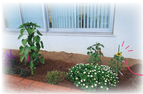
2月21日、北部営農経済センターの花壇に、小さなひまわりが花開きました!