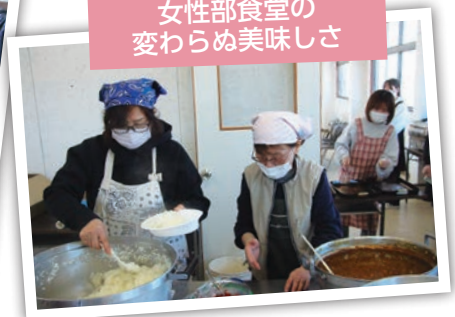
女性部食堂の 変わらぬ美味しさ