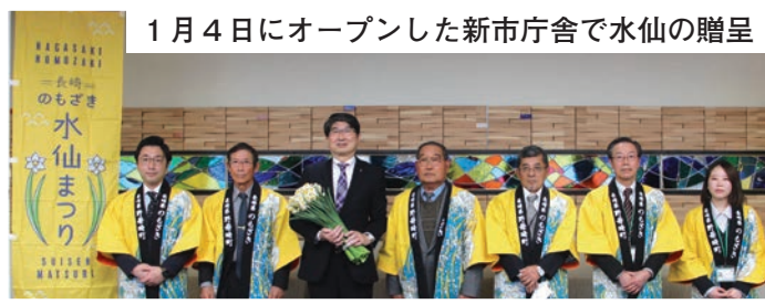
1月4日にオープンした新市庁舎で水仙の贈呈

今年度は夏から秋にかけて雨不足による乾燥で成長が遅れ、見頃は今月下旬にずれ込む見込みとなっています。