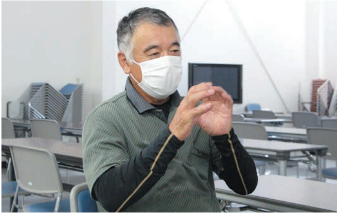
取材を受ける谷川部会長