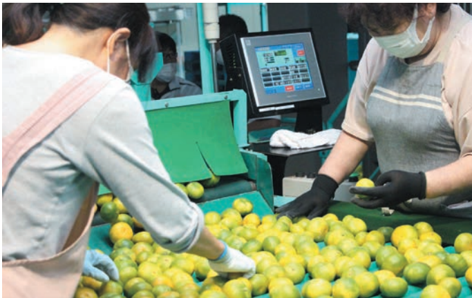
極早生みかんの選果の様子