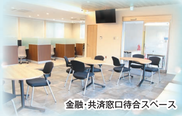
金融・共済窓口待合スペース

新店舗については、「組合員・利用者との対話を重視した店舗作り」を基本に、省エネルギーと創エネルギーでゼロエネルギーを目指した建築物「ZEB」*とし、SDGsへの取り組みや金融共済事業のデジタル化への変革に即応できる営業形態等、様々な取り組みが詰まった店舗となっております。