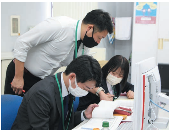
研修を受ける新入職員ら

新入職員らは「より実践に近い研修ができた。明日からの業務を頑張りたい」と話しました。