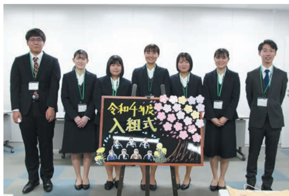
4月1日に入組した新入職員ら

当JAは4月1日に本店で入組式を開きました。今年度は新たに7人の職員を採用しました。入組式では新採用職員一人ひとりが社会人としての決意や今後の職務に対する意気込み、組合員への思いを発表しました。