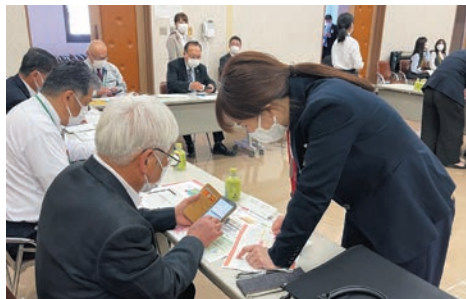
スマホ教室で説明を受ける理事ら