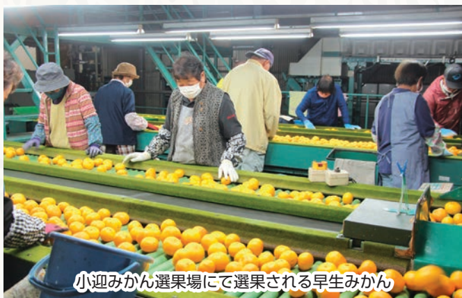
小迎みかん選果場にて選果される早生みかん

早生みかんは極早生みかんに比べると色味が強く、香りも濃くなっています。早生みかんの出荷状況を見ながら、12月上旬からは普通みかんの販売も開始する予定です。