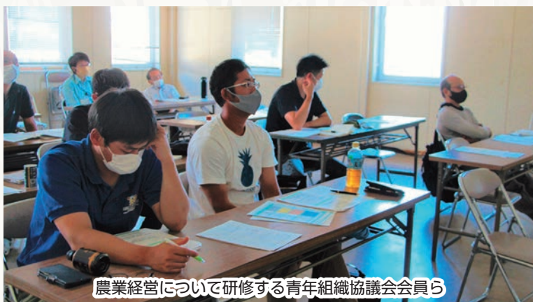
農業経営について研修する青年組織協議会会員ら

研修会終了後には、新規就農者と青年組織協議会員らの対話会を開き、新規就農者の相談を受けるなど、青年組織協議会員らとの交流を深めました。