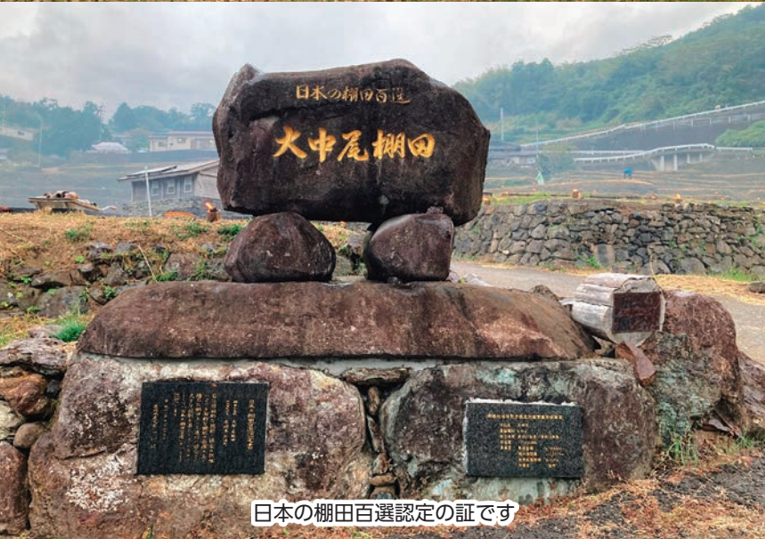
日本の棚田百選認定の証です