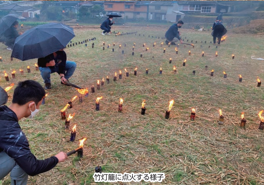
竹灯籠に点火する様子