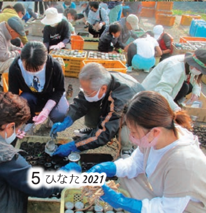
5 ひなた 2021