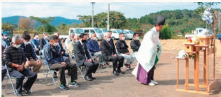
北部地区畜魂慰霊祭