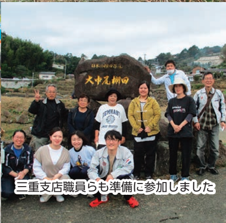
三重支店職員らも準備に参加しました