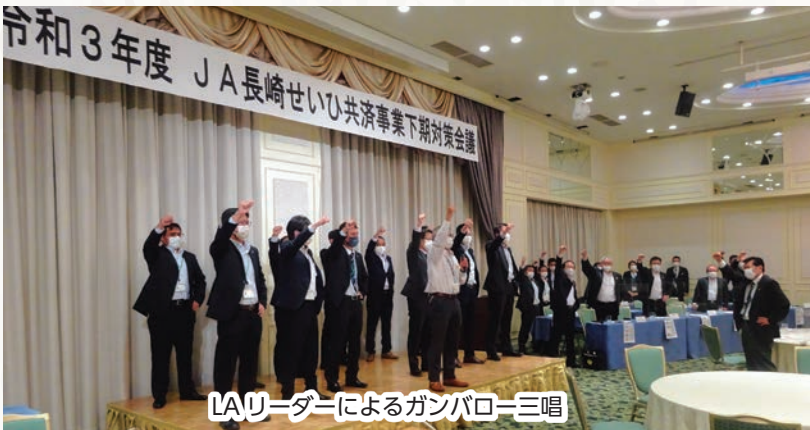
LAリーダーによるガンバロー三唱

JA長崎せいひは10月22日にサンプリエール(長崎市元船町)で「共済事業下期対策会議」を開きました。全体会議で下半期の取り組みを共有しLA(ライフアドバイザー)の達成意識の結集を図りました。