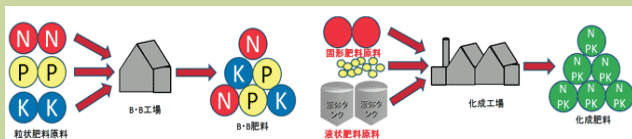
—BB肥料と化成肥料の違い—

／知ってましたか？「BB肥料」と「化成肥料」の違いについて／ BB肥料は化成肥料と比較し、 製造コストが安く 、比較的小ロットから製造できるため、地域の土壌や土壌分析結果に基づいた 適正施肥が可能 です。