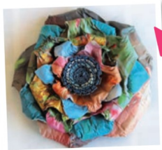
新聞紙で作ったブローチ