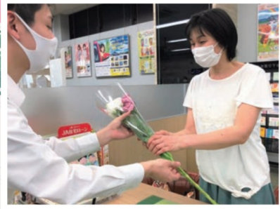
窓口で組合員・利用者に企画内容を説明して花束をプレゼントする職員(左)

JA 長崎せいひは6月9日に各金融店舗窓口で、第2回花き生産者応援プロジェクト「花束無料配布」を実施しました。