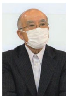
挨拶をする 森口組合長