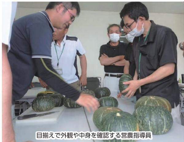
目揃えで外観や中身を確認する営農指導員

出荷規格・選別基準の説明を行った営農指導員らは収穫出荷時の注意事項として、10日間程度の風乾を行い、完熟果で肉質黄味の強いものとし、未熟果、生傷果は出荷しないよう生産者へ呼びかけました。