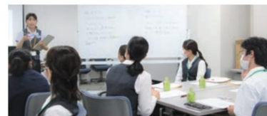
研修会で新人職員の育成について学ぶトレーナー