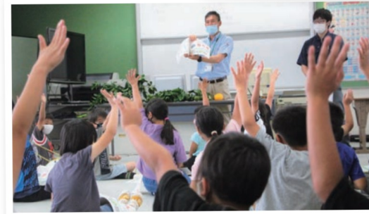
講師からのクイズに元気よく手を上げて答える児童たち