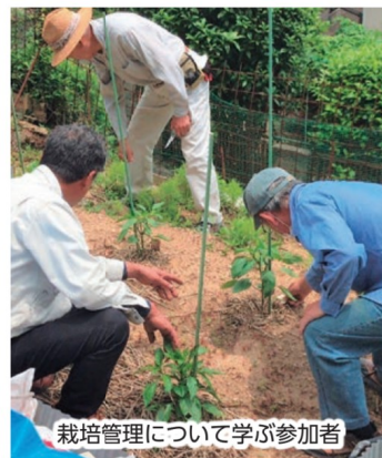
栽培管理について学ぶ参加者

今後は年6回程度の講習会を予定。時期に応じた栽培のポイントや、栽培者が取扱う野菜について講義する予定です。