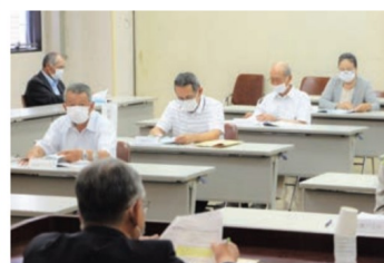
ソーシャルディスタンスを保った通常総代会のようす