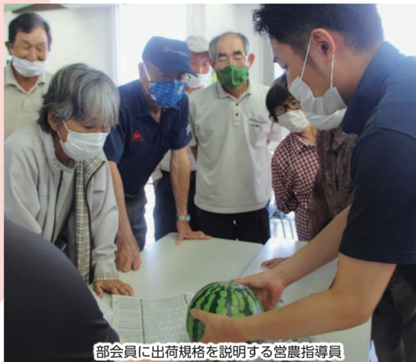
部会員に出荷規格を説明する営農指導員

営農指導員は「週間天気予報を活用し、病害虫の発生予防に心がけ、安定したすいかの生産を行い、適期収穫による品質の安定を図り、有利販売に努めたい」と話しました。