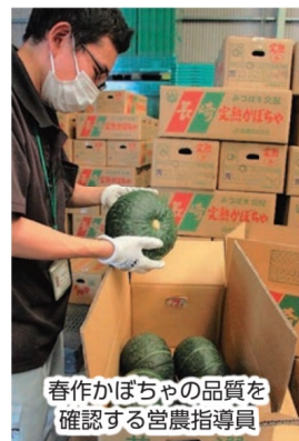
春作かぼちゃの品質を確認する営農指導員