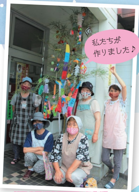
下郷笑おう会の皆さん

Aコープ多以良店に来店したお客様も彩り豊かな七夕飾りを眺めながら買い物を楽しみました。