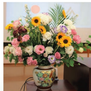
JA長崎せいひ産花きを使用した式典花