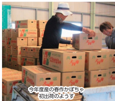
今年産の春作かぼちゃ初出荷の様子