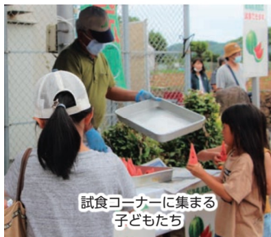
試食コーナーに集まる子どもたち