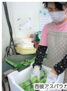
西彼アスパラガス選果場の様子

10 ヘクタール 当たり平均収量は、1,095 キロ が目標。夏芽の出荷本格化を前に、肥培管理と病害虫防除の徹底に努め、高品質のアスパラガスの出荷を目指します。