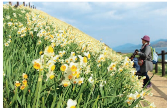
一面に咲くスイセン(1月15日、長崎市野母町)

福岡県から来た女性(30代)は「花畑の間を歩くのが楽しかった。スイセンはもっと小さいイメージがあったけれど、思ったよりも大きく立派で、花がたくさんついていて綺麗。来て良かった」と喜んだ。