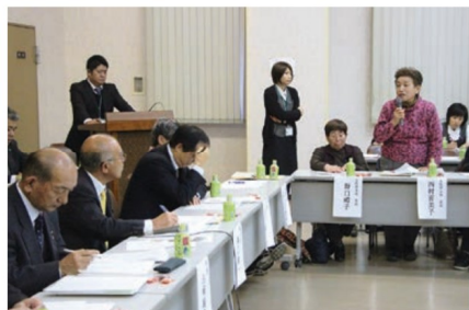
女性部事務局について要望する女性部員とそれを聞く役員

基本的なことであり、朝礼等でも挨拶和を行い挨拶の重要性について認識させております。また挨拶は本来ならできて当たり前のことであります。第5次中期経営計画で掲げる「選ばれる事業構築」を実践する上でも重要であり、職員教育の徹底に努めて参ります。