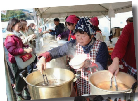
あっつあつのおでんをどうぞ! (女性部)

中部地区 JA 祭で毎年好評の「ちびっこのど自慢大会」をはじめ、生産者が丹精込めて作り品評会に出品した農産物の展示即売会、青年部の餅つき、抽選会や餅まき、大西海 SPF 豚の試食即売など多彩なイベントを実施しました。女性部も両地区からおでんやぜんざい、まんじゅうや味噌などの各支部の特色ある出店があり、地区を超えて交流する場面もありました。