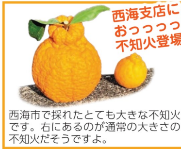
西海市で採れたとても大きな不知火です。右にあるのが通常の大きさの不知火だそうですよ。

今年産は露地で487ト、ハウスで150ト、合計で637トと前年よりやや多い出荷を計画している。