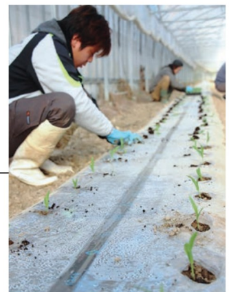
次々と植えられていくスイートコーン（1月21日、長崎市松崎町）