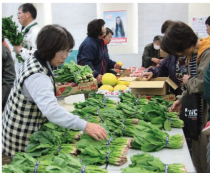
新鮮野菜を求めて駆け付けた近隣の人々

同品評会は30年以上前から毎年開催する伝統行事。地域の活性化や農業振興に繋がると共に、地域住民との交流を深める場となっている。地元の子どもたちが餅つきに参加したり、集まった農産物を見に来たりと楽しむ様子もあった。お楽しみ抽選会や即売会にも多くの人が集まり部員らと交流した。