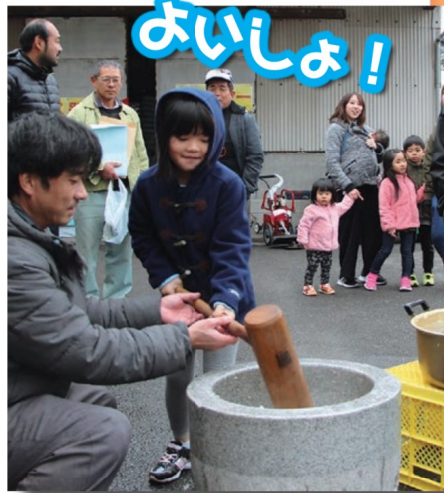
子どもたちも餅つきを体験 (青年部)