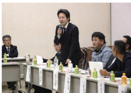
ホームセンター建設について要望する青年組織協議会員

今年度は開催地が中部地区の開催となったため1月開催となりましたが、懸念されていた品評会への出品数も若干少なかったものの、3000点以上の出品協力を頂きました。今後は、J A祭の実績並びに内容