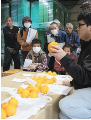
目揃え会で営農指導員の説明を聞く生産者ら（1月23日、西海市西彼町）