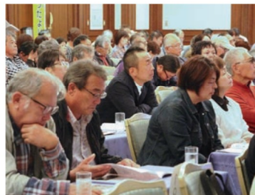
研修を受ける参加者ら