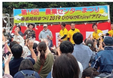
餅まきをするJA青年部と東長崎商工会青年部 (11月3日、長崎市戸石町)

農業センターを軸として地域住民とのふれあいを促進し「農業」と「食」に対する理解を深めるとともに、東長崎地区の代表的なイベントとなることを目指す。農産物の販売や農業関連イベント、ペンギンとのふれあいや防災体験など多彩なイベントの中、JA青年部はミカンの詰め放題を実施した。