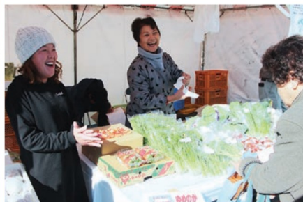
長崎市認定農業者連絡協議会による 多様な農産物の販売