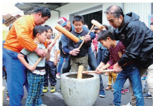
地元児童らが餅つき体験

ミカン狩りには諫早市内外から旬の味を求めて来場しました。来場客の1人は「子どもと一緒に、眺めのいい場所で、自分たちで採ったミカンを食べることができてとても楽しい」と笑顔で話しました。JA長崎せいひは、このミカン狩りに毎年住宅ローンの利用者を招待しています。農業イベントを活用し、他の金融機関には無いJAらしい取り組みを通して、JAファンづくりに繋げています。