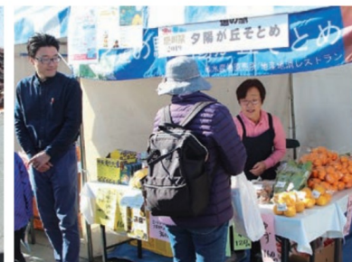
「ゆうこう」や「ド・ロさまそうめん」 など地元特産物を販売