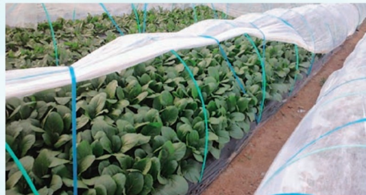
浮きがけ(2)を活用した栽培