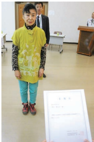
委嘱状を受け取る相談員 (11月20日、長崎市興善町)

JA長崎せいひは11月20日、本店で地域の代表13人と職員13人に「結婚相談員」として委嘱状を交付した。農業の振興、地域社会の活性化を推進する一環として、同相談員らを中心に婚活事業を進める。