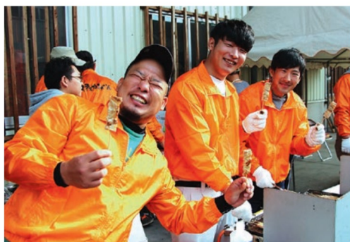
美味しい串焼きを販売

生産者らでつくる交流体験実行委員会は11月17日、諫早市多良見町で「伊木力みかん収穫祭」を開きました。園地でミカン狩りを楽しむことができ、毎年多くの来場客で賑わう人気イベントです。伊木力みかん選果場では、ステージイベントにて子どもたちをはじめとする多くの人たちが和太鼓演奏や吹奏楽演奏、バンド演奏などでイベントを盛り上げました。出店もずらりと並び、食を楽しむこともできました。地元女性部や青年部も出店しました。