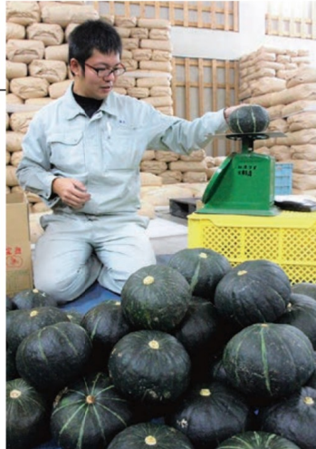
選別作業を進めるJA職員 (12月4日、西海市西彼町)

この日までに集荷したカボチャは1.5ト。引き続き集荷し、約3トとなる見込み。福井県の市場に向けて出荷する。