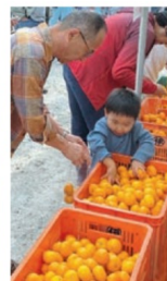
ミカンの詰め放題