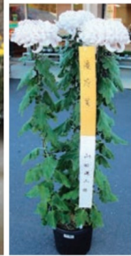
優等賞を獲得した菊