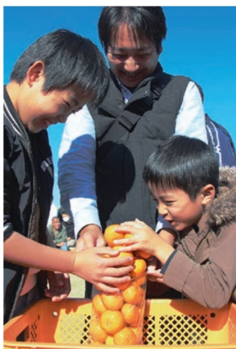
親子で袋いっぱいに詰める参加者

JAからは直売所「夕陽が丘そとめ」「太陽の郷」が出店した他、ステージイベントでミカンの詰め放題を実施。市内茂木地区で採れた100kgの温州ミカンがあったという間に完売した。参加した子どもは「いっぱい買えて嬉しい。食べるのも楽しい」と話した。