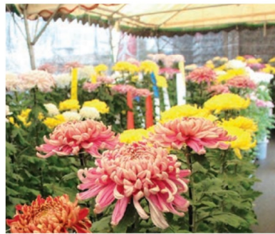
テントいっぱい並び菊 (11月7日、長崎市矢上町)