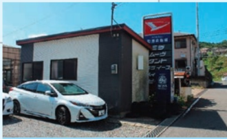
若浦自動車 長崎市為石町3194-4 TEL 095-892-8369