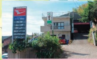
イワナガ商会 長崎市早坂町1311 TEL 095-836-0723