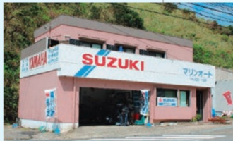
マリンオート 長崎市野母町1152-4 TEL 095-893-1199