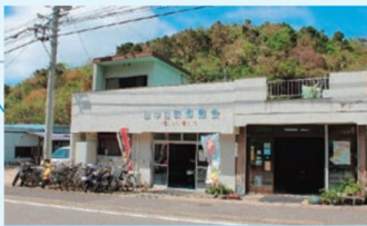
田中自転車商会 長崎市野母町72-3 TEL 095-893-2812

※ひなた 10月号 10ページ「共済代理店紹介」につきまして、三重支店の共済代理店の電話番号を誤って掲載しておりました。誤記のお詫びを申し上げます。 オートサービス赤坂 TEL 095-884-1855