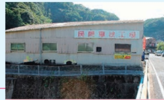
山崎自動車整備工場 長崎市茂木町302 TEL 095-836-1628