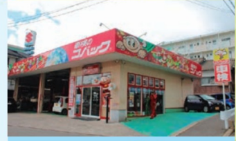
シーク自動車 長崎市香焼町395-8 TEL 095-871-5784