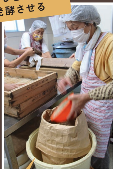
⑦ こうじを作るため 発酵させる