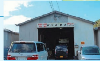
坂口自動車 長崎市竿浦町1102-4 TEL 095-878-0870