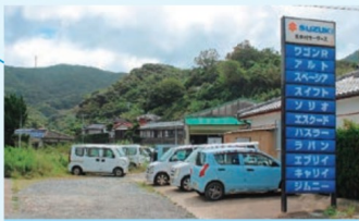
本村モータース 長崎市高浜町3203-138 TEL 095-895-3541