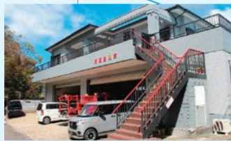
浦瀬自動車整備工場 長崎市宮崎町127-31 TEL 095-892-0255