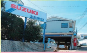
久保自動車整備工業 長崎市田上2丁目17-51 TEL 095-822-0420