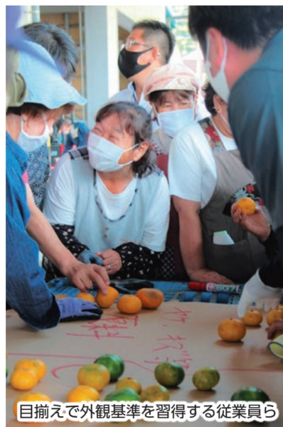
目揃えで外観基準を習得する従業員ら

初選果式終了後には、従業員らが選果場に集まり、場長や営農指導員説明のもと、目揃えを行いました。従業員らは外観基準を細かく確認し、選果作業に努めました。