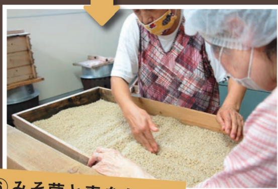
⑥ みそ菌と麦をませる