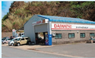
オートサービスオオムラ 長崎市野母町1169-1 TEL 095-893-2732

各支店別に代理店 のご紹介を順次させて いただきます。 また、万一、事故が 起こったら