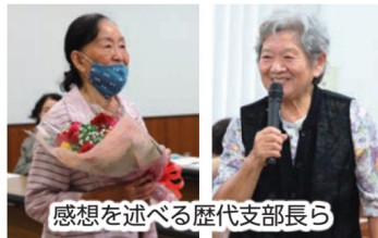
感想を述べる歴代支部長ら