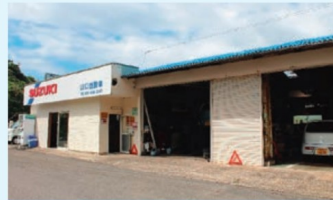
山口自動車 長崎市高浜町4169-2 TEL 095-894-2360