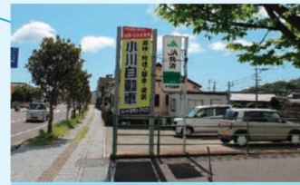
小川自動車 長崎市為石町4559 TEL 095-892-1548