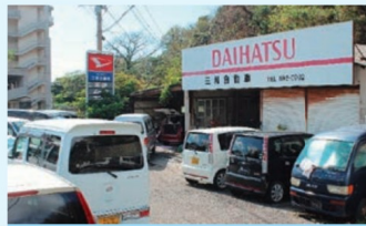
三和自動車 長崎市為石町3747-1 TEL 095-892-0702