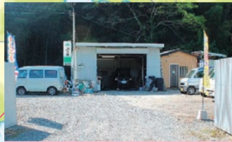
カー・メンテナンス 宏自動車 長崎市茂木町1-117 TEL 095-836-3454