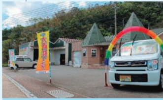
オートモービル長崎 長崎市為石町3135-2 TEL 095-892-8811