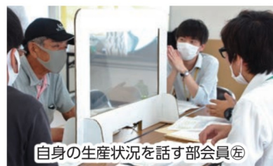
自身の生産状況を話す部会員

検討会では2019年産の生産・販売実績や、面積当たりの販売高・収量を部会平均と比較。単価の部会平均を記載した「販売実績簡易分析シート」と、過去3年間の決算推移を記した「決算データ簡易シート」を用いながら県やJA 長崎県中央会、JA 職員らと生産者が個別に面談しました。シートからは見えない他作物の生産、後継者のことも含めて各生産者が抱える問題点を抽出し、その改善策を探りました。農林中央金庫長崎支店とJA 東長崎支店金融担当者も参加しました。営農資金や新型コロナウイルス感染予防対策に関する資金制度を案内。相談にも対応しました。